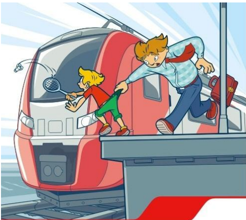
Платформа – не место для игр!