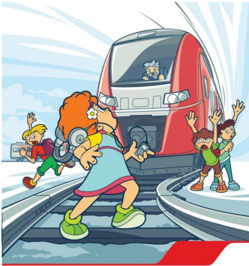
Плеер и железная дорога - несовместимы!